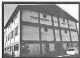
FRATERNIDADE ESPÍRITA IRMÃO GLACUS