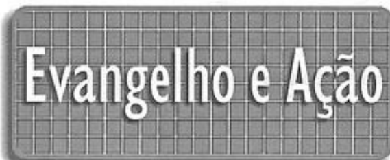
ÓRGÃO DE DIVULGAÇÃO DA FRATERNIDADE ESPÍRITA IRMÃO GLACUS - FUNDADO EM ABRIL DE 1988 RUA HENRIQUE GORCEIX, 30 - PADRE EUSTÁQUIO - CEP: 30.720-360 - BELO HORIZONTE - MINAS GERAIS