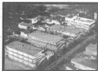
FUNDAÇÃO ESPÍRITA IRMÃO GLACUS