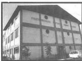
FRATERNIDADE ESPÍRITA IRMÃO GLACUS