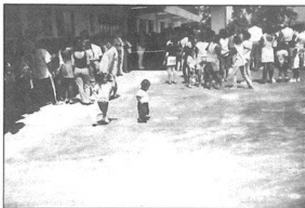
Na inauguração do Ambulatório Irmão José Grosso muitas pessoas estavam presentes.