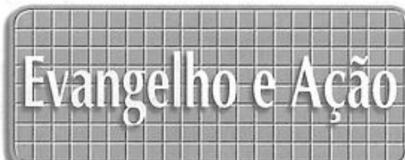
ORÇÃO DE DIVULGAÇÃO DA FRATERNIDADE ESPÍRITA IRMÃO GLACUS • FUNDADO EM ABRIL DE 1988 RUA HENRIQUE GORCEIX, 30 • PADRE EUSTÁQUIO • CEP: 30.728-360 • BELO HORIZONTE • MINAS GERAIS