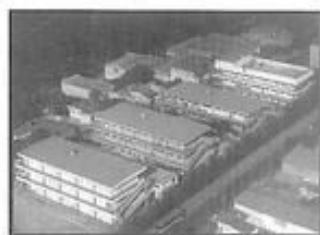
FUNDAÇÃO ESPÍRITA IRMÃO GLACUS