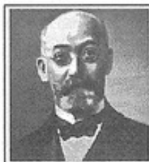
LÁZARO LUIZ ZAMENHOF O iniciador do Esperanto

"Nascer, morrer, renascer ainda e progredir sempre, tal é a lei."