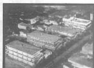
FUNDAÇÃO ESPÍRITA IRMÃO GLACUS

ÓRGÃO DE DIVULGAÇÃO DA FRATERNIDADE ESPÍRITA IRMÃO GLACUS - FUNDADO EM ABRIL DE 1988 RUA HENRIQUE GORCEIX, 30 - PADRE EUSTÁQUIO - CEP: 30.720-300 - BELO HORIZONTE - MINAS GERAIS