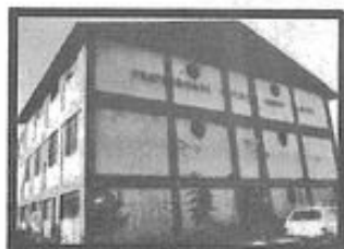
FRATERNIDADE ESPÍRITA IRMÃO GLACUS