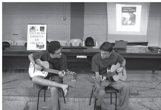
Jovens harmonizaram o evento através da música

Para educar é preciso educar-se. Walter alertou para o fato de que para educar é preciso conhecer profundamente o orgulho e o egoísmo a fim de tirá-los do coração. Esses cânceres da alma, de acordo com ele, só serão tratados e eliminados na convivência. “Na medida em que vamos eliminando essas cáries do coração, seremos verdadeiros servos do amor do Mestre Jesus e a