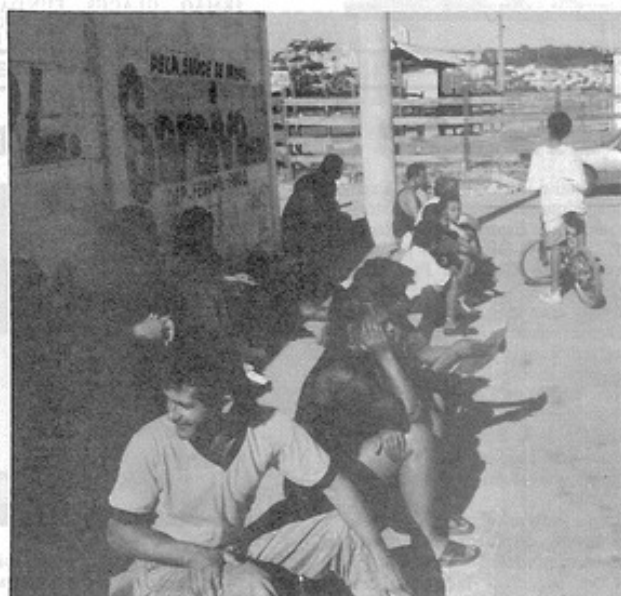
Pessoas aguardando para serem atendidas na F.E.I.G.