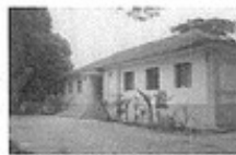
Instituto Raul Soares

"E, quando já chegava perto da descida do Monte das Oliveiras, toda a multidão dos discípulos, regozijando-se, começou a dar louvores a Deus em alta voz, por todas as maravilhas que tinham visto." Lucas 19,37