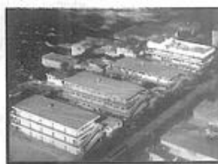
FUNDAÇÃO ESPÍRITA IRMÃO GLACUS