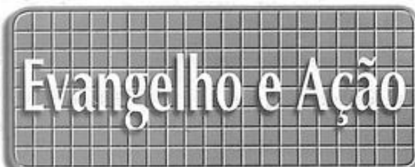
ÓRGÃO DE DIVULGAÇÃO DA FRATERNIDADE ESPÍRITA IRMÃO GLACUS • FUNDADO EM ABRIL DE 1988 RUA HENRIQUE GORCEIX, 30 • PADRE EUSTÁQUIO • CEP: 30.720-360 • BELO HORIZONTE • MINAS GERAIS