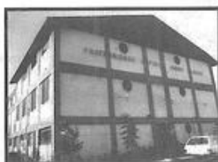
FRATERNIDADE ESPÍRITA IRMÃO GLACUS