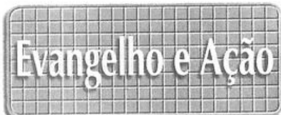
ÓRGÃO DE DIVULGAÇÃO DA FRATERNIDADE ESPÍRITA IRMÃO GLACUS - FUNDADO EM ABRIL DE 1988 RUA HENRIQUE GORCEIX, 30 - PADRE EUSTÁQUIO - CEP: 30.720-360 - BELO HORIZONTE - MINAS GERAIS