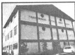
FRATERNIDADE ESPÍRITA IRMÃO GLACUS