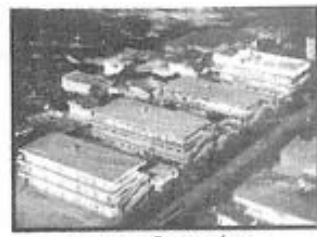
FUNDAÇÃO ESPÍRITA IRMÃO GLACUS