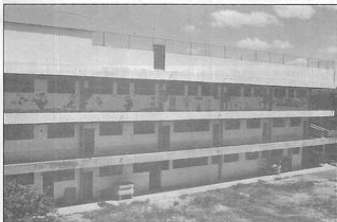
O 1º andar do Pavilhão José Grosso está sendo equipado para iniciar suas atividades na área de saúde

A Fraternidade Espírita Irmão Glacus está concluindo mais uma etapa do seu crescimento. Os cursos de profissionalização já estão funcionando como matéria do Colégio Rubens Romanelli e dentro de pouco tempo irão se expandir para a região do Ressaca. Em médio prazo teremos datilógrafos, bombeiros, marceneiros e eletricitistas prediais no mercado de trabalho, formados pela Fundação Espírita Irmão Glacus que, conforme programado vem cumprir sua função, ESCOLA. Lembrando ainda o curso de Computação que já está em funcionamento.