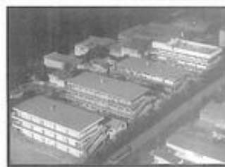
FUNDAÇÃO ESPÍRITA IRMÃO GLACUS