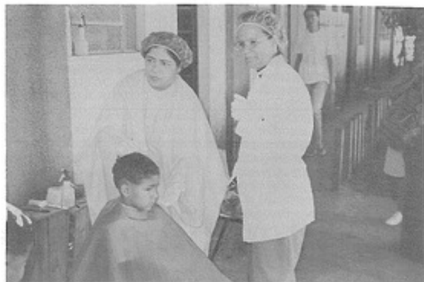
As crianças são tratadas com amor e carinho pelos tarefeiros da Casa de Glacus