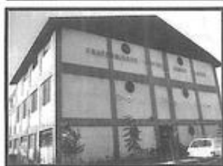
FRATERNIDADE ESPÍRITA IRMÃO GLACUS