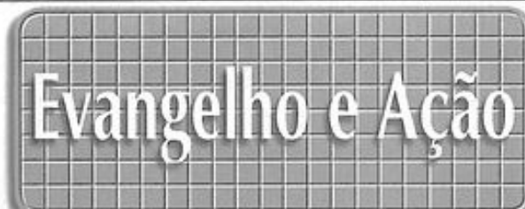
ÓRGÃO DE DIVULGAÇÃO DA FRATERNIDADE ESPÍRITA IRMÃO GLACUS • FUNDADO EM ABRIL DE 1988 RUA HENRIQUE GORCEIX, 30 • PADRE EUSTÁQUIO • CEP: 30.720-360 • BELÓ HORIZONTE • MINAS GERAIS