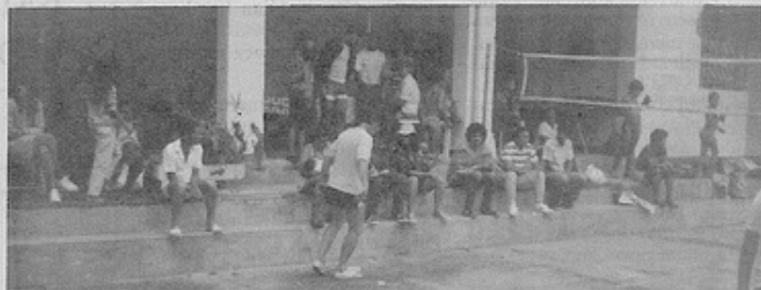
No décimo terceiro aniversário da F.E.I.G., jogos, torneios e brincadeiras

Foi uma festa linda, acompanhada de um delicioso almoço. E entre jogos e brincadeiras, pudemos sentir a alegria da grande família da casa de Glacius, que torna-se cada dia mais numerosa e operosa, trabalhando sempre pelo crescimento de todos.