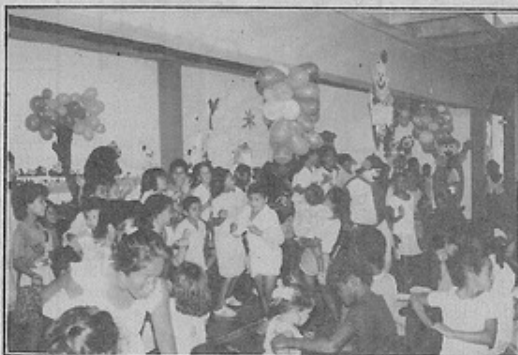
No convívio com palhaços, balões e música as crianças fizeram a festa

Mais uma vez o Departamento de Evangelização infanto-juvenil está de parabéns pela bonita festa.