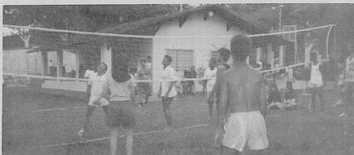
A natureza presente na confraternização dos fraternistas