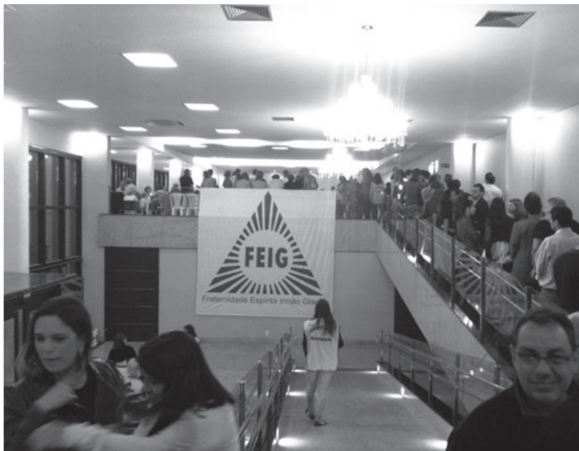
Confraternização foi a palavra de ordem de mais um jantar da FEIG

Disponível em: < http://www.feig.org.br/index.php/nstituicao/noticias/intermas/607-jantar-dancante-reune-650-pessoas >.