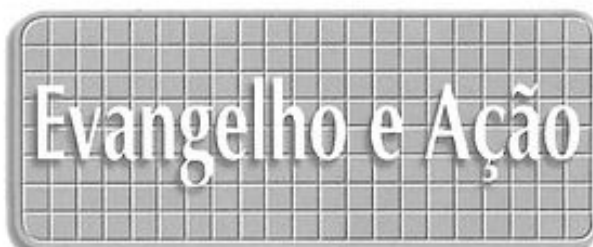
ÓRGÃO DE DIVULGAÇÃO DA FRATERNIDADE ESPÍRITA IRMÃO GLACUS • FUNDADO EM ABRIL DE 1988 RUA HENRIQUE GORCEIX, 30 • **DRE EUSTÁQUIO • CEP: 30.720-360 • BELO HORIZONTE • MINAS GERAIS