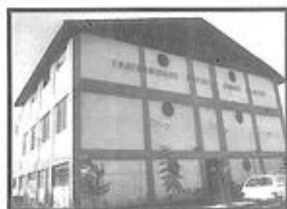
FRATERNIDADE ESPÍRITA IRMÃO GLACUS