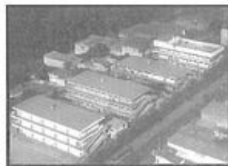
FUNDAÇÃO ESPÍRITA IRMÃO GLACUS