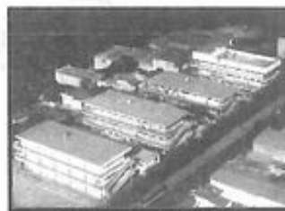
FUNDAÇÃO ESPÍRITA IRMÃO GLACUS