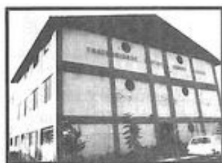
FRATERNIDADE ESPÍRITA IRMÃO GLACUS