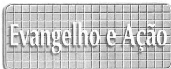
ÓRGÃO DE DIVULGAÇÃO DA FRATERNIDADE ESPÍRITA IRMÃO GLACUS • FUNDADO EM ABRIL DE 1988 RUA HENRIQUE CORCÊIX, 30 • PADRE EUSTÁQUIO • CEP: 30.728-340 • BELO HORIZONTE • MINAS GERAIS