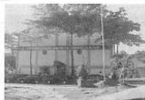
Fraternalidade Espírita Irmão Glacus