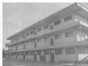
Fundação Espírita Irmão Glacus