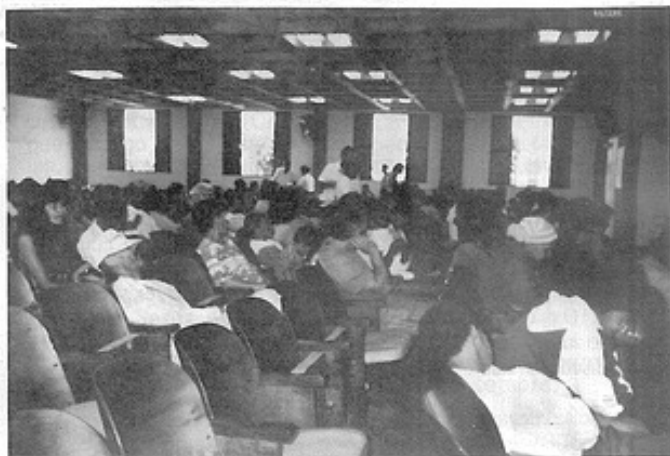
Evangelização de adultos aos sábados, na F.E.I.G

Romanelli de 1º e 2º graus para 2700 alunos, já em funcionamento parcial.