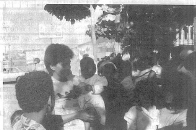
No atendimento fraterno a F. E. I. G. completa 19 anos