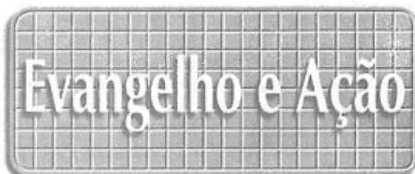
ÓRGÃO DE DIVULGAÇÃO DA FRATERNIDADE ESPÍRITA IRMÃO GLACUS • FUNDADO EM ABRIL DE 1968 RUA HENRIQUE GORCIEZ, 30 • PADRE EUSTÁQUIO • CEP. 30.720-360 • BELO HORIZONTE • MINAS GERAIS