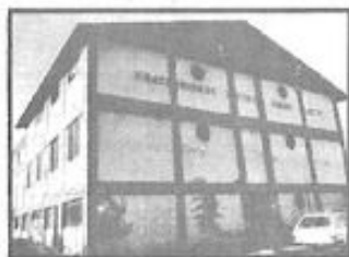
FRATERNIDADE ESPÍRITA IRMÃO GLACUS