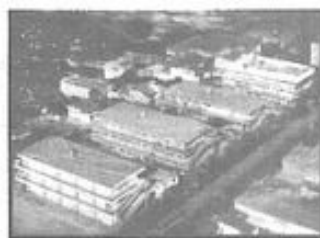
FUNDAÇÃO ESPÍRITA IRMÃO GLACUS