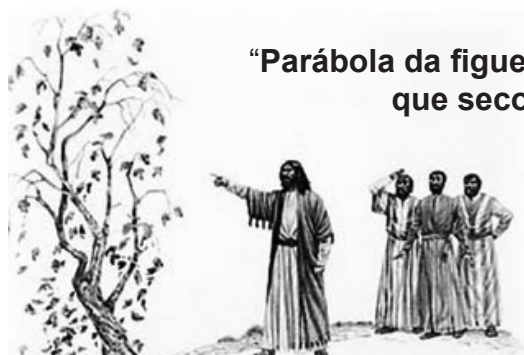
“Parábola da figueira que secou”

Prezados irmãos, costumamos lembrar em nossas palestras que nada, absolutamente nada do que está escrito nos Evangelhos pode ser descartado. Tudo, absolutamente tudo que neles está contido tem um sentido, tem uma mensagem. A propósito disso, Paulo na 2ª carta aos Coríntios 3:6, deixou-nos uma profunda advertência a este respeito ao afirmar “a letra mata, mas o espírito vivifica” ou seja, devemos retirar da letra o espírito, da escrita o conteúdo, este, naturalmente, alinhado com o que foi o ensino e o comportamento do Cristo.