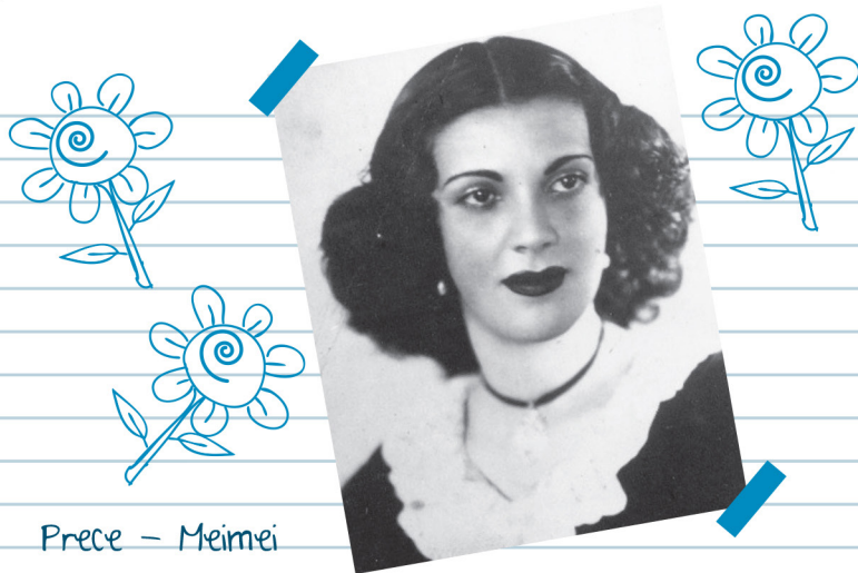
Prece - Meimei

Olá amiguinho(a), Você conhece a MEIMEI?